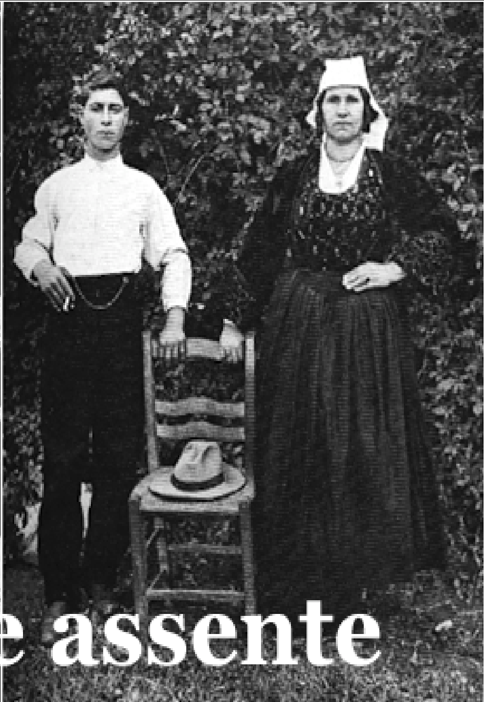
Il padre assente