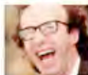
ALLEGRI Il sorriso di Roberto Mancini è aperto. Espone i denti.