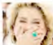
INNOCENTE Il sorriso di Catherine Deneuve ha i tratti dell'innocenza.