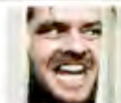
CINCO Jack Nicholson che digrigna i denti e l'immagine della cattiveria.