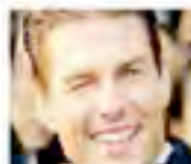
CONSPIRATIVO Tom Cruise sorride con la bocca sigillata.